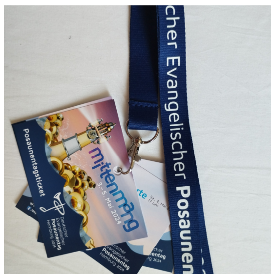
Bild zum DEPT 2024

Wir hatten bereits beim Konzert im Sommer 2024 mitgewirkt, das Dorffest und den Weihnachtsmarkt bereichert und auch sonst viel Spaß bei allen weiteren Aktionen.