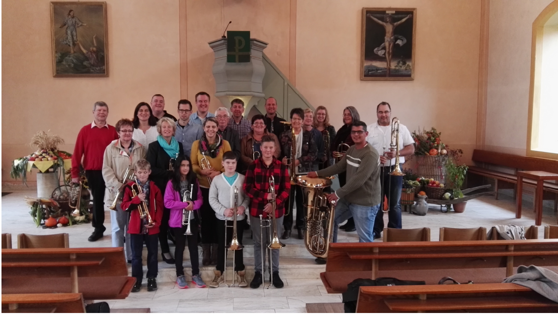
Bild: Erntedankfest 2015

Im Jahr 2016 haben einige Bläserinnen und Bläser am Bundesposaumentag in Dresden teilgenommen. Zur musikalischen Vorbereitung, wie auch für die Pflege der Gemeinschaft wurde ein Bläserwochenende abgehalten. Im Juli hatten wir ein tolles Konzert in der Kirche und im Herbst waren wir Gastgeber des Bezirksbläserwochenendes.