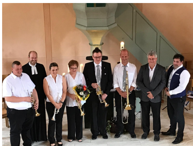
Bild Geehrte 2019

Im Frühjahr 2020 begann die Corona Pandemie, die auch unseren Chor 2 Jahre lang stark einschränkte. Wochen- und Monatelange Verbote sich zu treffen, dann Hygienevorschriften und Abstandsregeln ließen ab und zu Proben unter freiem Himmel zu. Auch im großen Bürgerzentrum durften wir einige Proben abhalten.