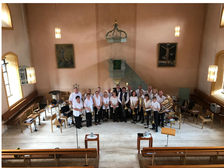
Bild: Konzert 2019

Für die Gemeinschaft und Geselligkeit gab es natürlich auch so einiges zu erleben. So hatten wir bspw. ein tolles Sommergrillfest, einen wunderschönen Ausflug als Wanderung nach Weisbach, Zwiebelkuchenessen und Weihnachtsfeier. Rundum ein gelungenes Posaunenchor- Jahr 2019.