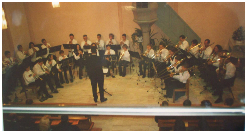
Bild 1999 Einführung Jungbläser

2000 geht es wieder mal in ein Bläserwochenende, das zweite in der Posaunenchorgeschichte, nach Brettheim, wieder Selbstversorger, wieder wurde viel geübt - und viel gefeiert. Es sind derzeit 34 BläserInnen zu zählen.