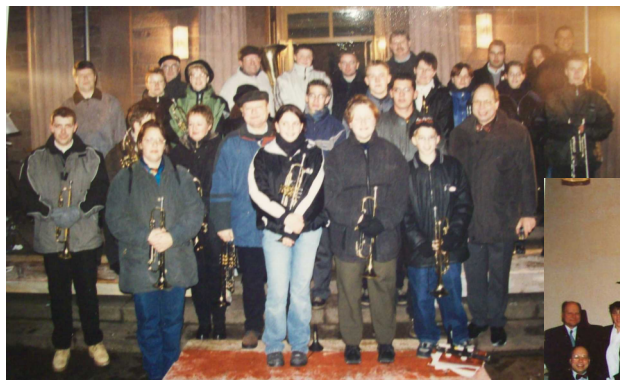
Bild Silvester 2000 / 2001