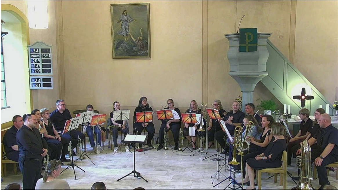
Bild Abendmusik 30.06.2024

Bis heute sind im Posaunenchor, in den vergangenen 124 Jahren, für kürzere oder längere Zeit, mit mehr oder weniger Einsatz und Engagement, ca. 160 Bläser und Bläserinnen aktiv dabei gewesen. Wow !