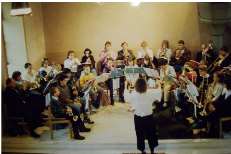
Bild 1990 Einführung Jungbläser